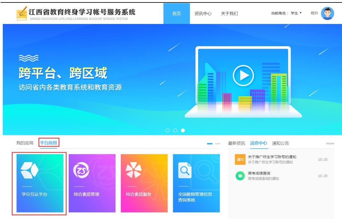
图1-2 终身学习账号服务系统登录后的界面