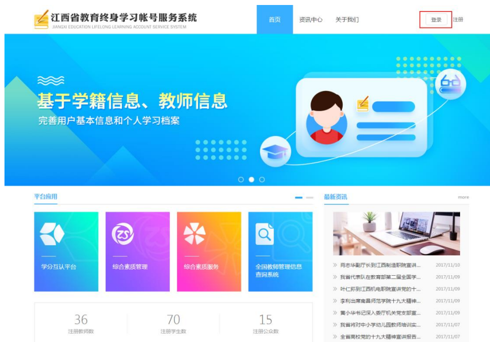
图1-1 终身学习账号服务系统界面

打开教育厅主页： http://11a.jxedu.gov.cn/ ； 进入“江西省教育终身学习账号服务系统”，如图 1-2。